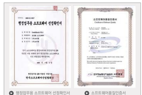
1 행정업무용 소프트웨어 선정확인서

하드디스크 용량 산출 : (계정수) x (Mailbox 용량) x (웹플더 용량)